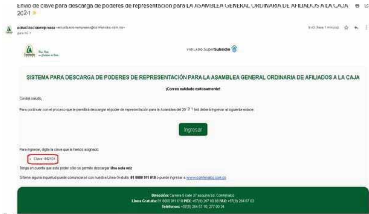
Imagen 4 (Datos En el correo electrónico)