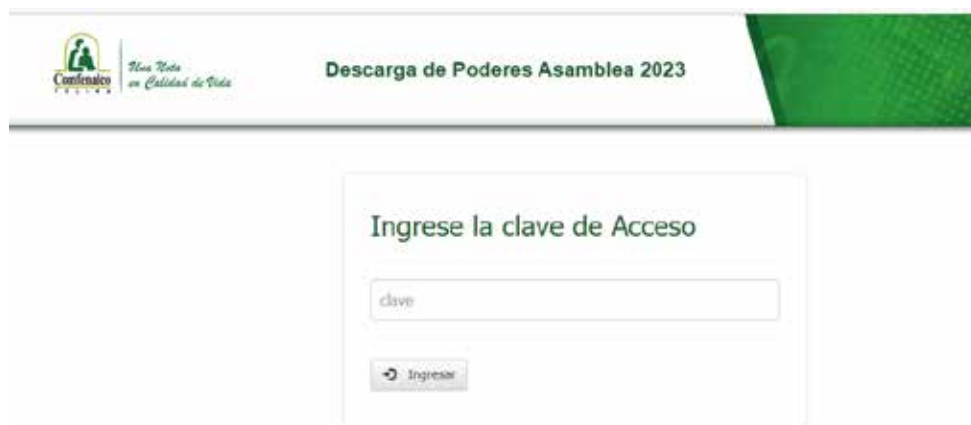
Imagen 5 (Digite la clave que se le envió al correo electrónico)