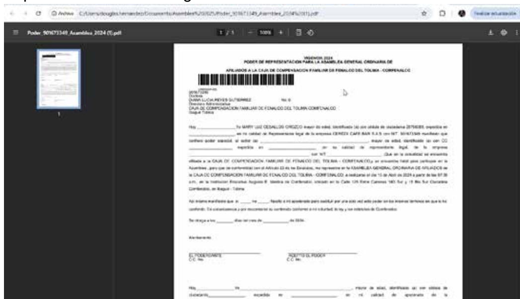
Imagen 8 (Visualización poder descargado y listo para imprimir)