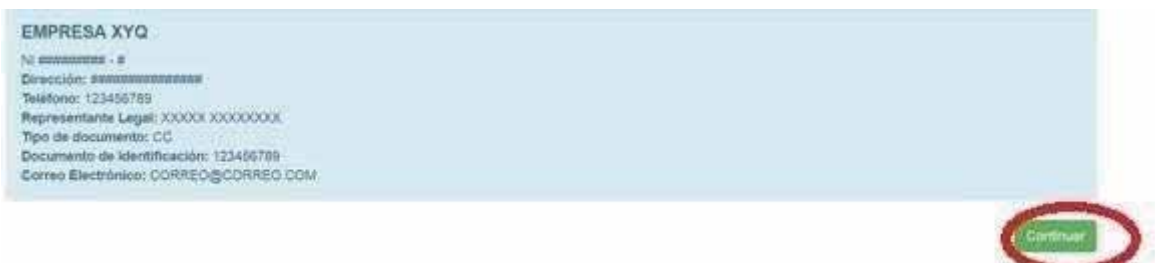
Imagen 3 (Datos Suministrados Correctos)

Si la información es correcta, se mostrará un cuadro azul como el siguiente, presione clic en continuar